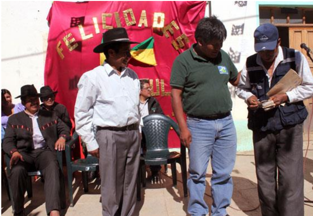
Foto: Viceministro de Desarrollo Rural y Agropecuario realiza la indemnización del seguro, en el Municipio de Tomina.