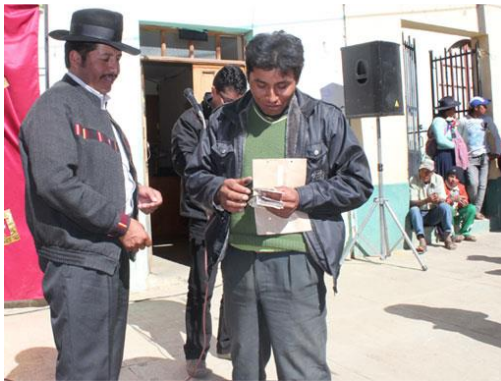
Foto: Agricultor recibe demanos del Gobernador Esteban Urquiza indemnización del