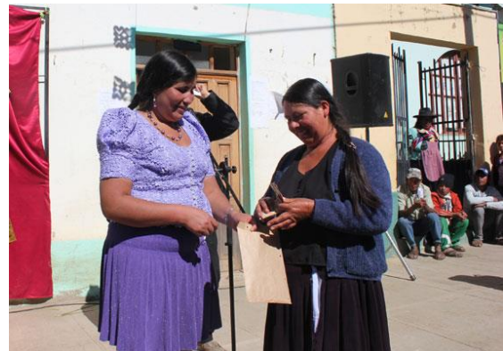
Foto: Senadora Nélida Sifuentes realiza la indemnización del seguro.