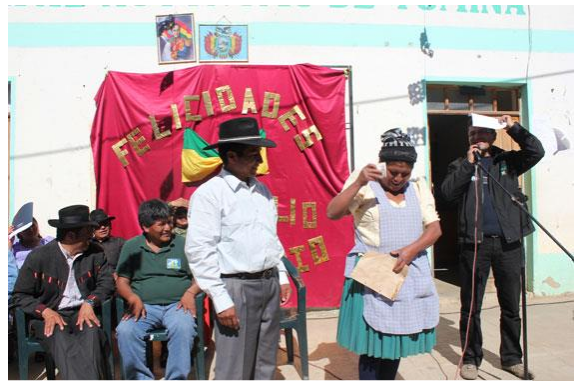
Foto: Alcalde municipal de Tomina realiza la indemnización a productora que perdió su cultivo.