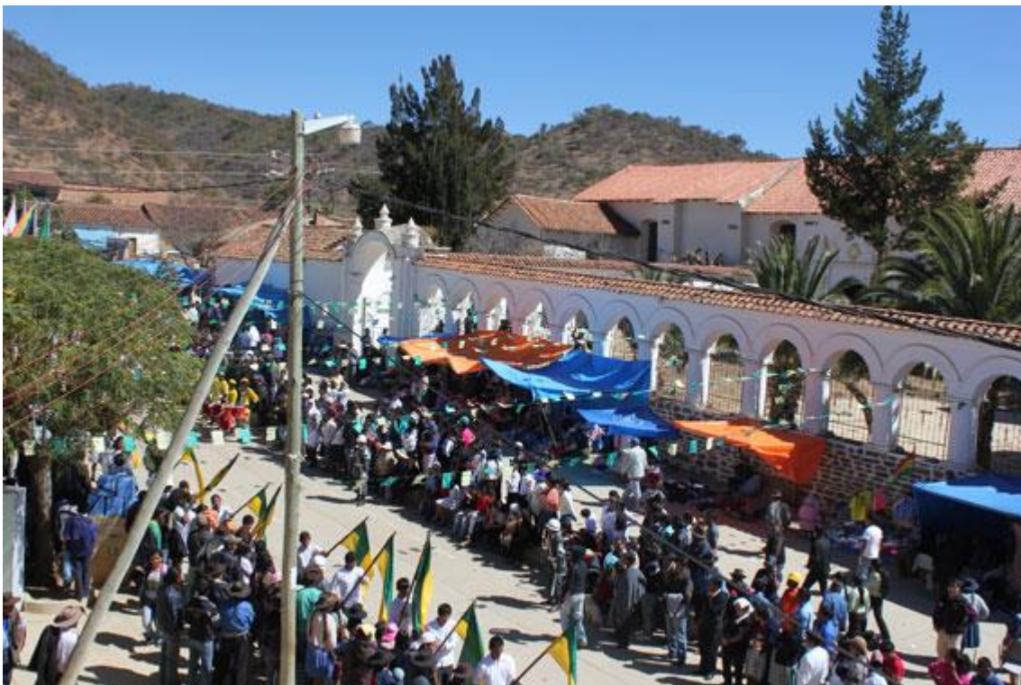
desfile cívico.