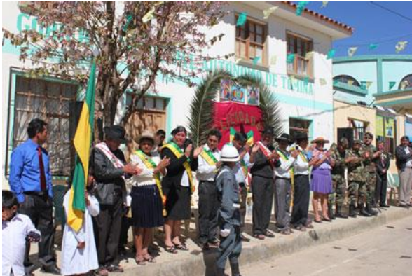
Foto: Autoridades nacionales, departamentales y municipales en el desfile cívico del municipio.