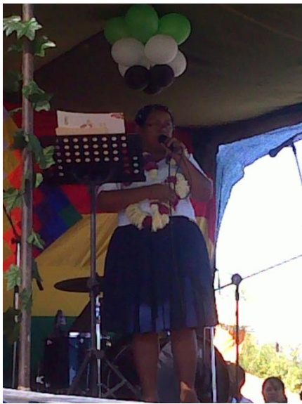
Foto: Ministra de Desarrollo Rural y Tierras Sra. Nemesia Achacollo expresa palabras de circunstancia.