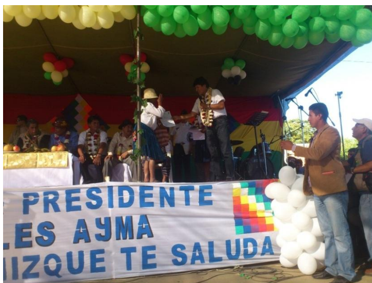
Foto: Presidente del Estado Plurinacional Evo Morales Ayma en evento titulación de tierras donde se continuo con la entrega de indemnizaciones.

El pasado miércoles 24 de abril el Presidente del Estado Plurinacional de Bolivia, Evo Morales Ayma y la Ministra de Desarrollo Rural y Tierras, Nemesia Achacollo Tola, continuaron con la entrega de indemnizaciones a productores agropecuarios en municipios afectados. Esta vez el acto fue realizado en el Municipio de Mizque del departamento de Cochabamba, en la oportunidad se pagó a productores afectados por granizada en los cultivos de papa, maíz y trigo correspondientes a la Comunidad de Quinsachata. La superficie indemnizada fue de 10 ha pertenecientes a 6 familias productoras llegando a un total de 10.000 Bs indemnizados. El departamento de Cochabamba ha reportado siniestros por 272 hectáreas, que una vez peritados en campo podrían implicar 272.000 Bs. en indemnizaciones en los siguientes meses.