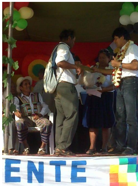
Foto: Presidente del Estado Plurinacional en compañía de la Ministra de Desarrollo Rural y Tierras indemniza a productor.