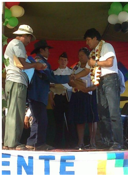
Foto: Agricultor recibe de manos del presidente indemnización del seguro.