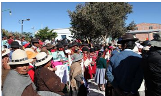
Foto: Productores esperan llegada del Presidente del Estado Plurinacional de Bolivia al Municipio de Turco.