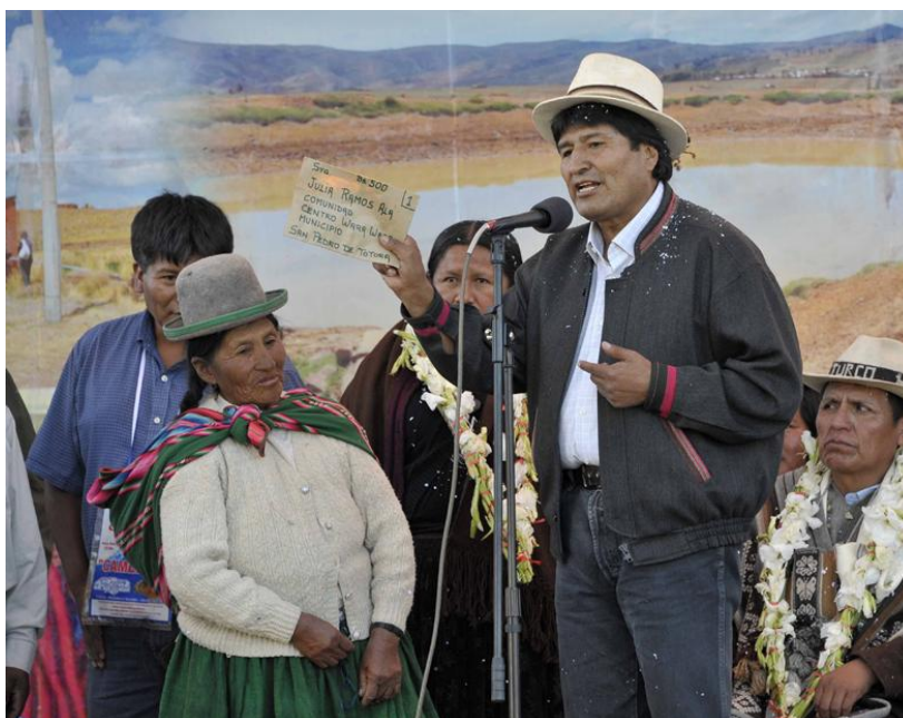
Foto: Presidente del Estado Plurinacional de Bolivia entrega recursos de indemnización a la Señora Julia Ramos, Comunidad WaraWara Centro

Continuando con las indemnizaciones del Seguro Agrario Universal Pachamama en su modalidad "PIRWA", el Presidente del Estado Plurinacional de Bolivia, Dn. Juan Evo Morales Ayma y la Ministra de Desarrollo Rural y Tierras, Sra. Nemesia Achacollo Tola, el pasado 23 de abril, en la localidad de Turco, entregaron personalmente los recursos económicos por indemnización de cultivos siniestrados a productores del Municipio de San Pedro de Totora del departamento de Oruro.