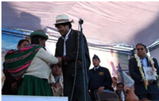
Foto: Productora de Wara Wara Centro recibe indemnización en el Municipio de Turco.