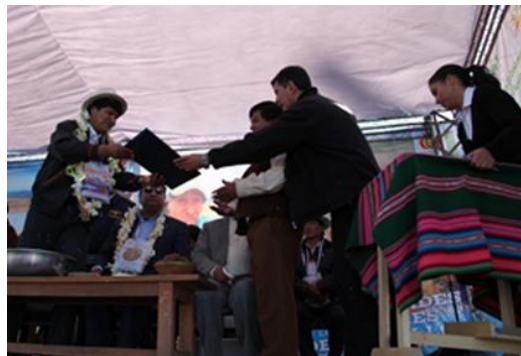
Foto: Firma de convenio para la implementación del Proyecto de Inversión Comunitaria en Áreas Rurales (PICAR) Oruro